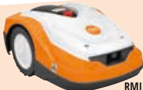
RMI 522 C